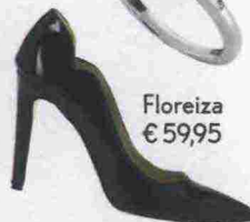
Floreiza € 59,95