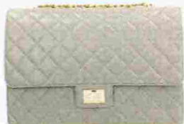
Designinverso € 135