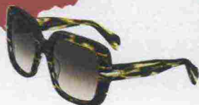
Rag & Bone by Safilo € 245