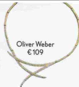
Oliver Weber € 109