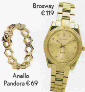
Brosway € 119

La tuta è elegante, comoda e di tendenza: se poi è color mattone come quella dell'attrice Kate Bosworth e accessoriata con le scarpe bebè e la borsetta matelassé (nella foto, di Miu Miu e di Chloé) è ancora più chic.