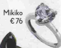
Mikiko € 76