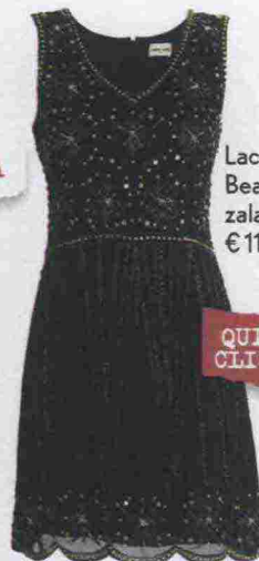
Lace & Beads su zalando.it € 114,99