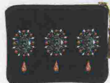
Vera Givèl € 50

Il total black per la sera è sempre una scelta azzeccata: ma per fare scintille ci vogliono ricami di stass, décolletées lucidissime e una clutch gioiello (nella foto, di Vera Givèl).