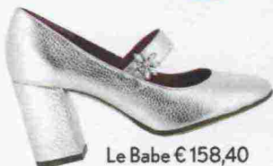
Le Babe € 158,40