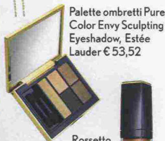
Palette ombretti Pure Color Envy Sculpting Eyeshadow, Estée Lauder € 53,52