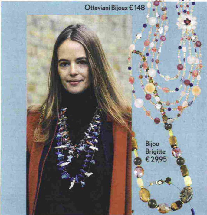
Ottaviani Bijoux € 148