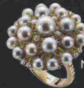
Mikiko € 197

ANELLI XXL L'IMPORTANTE È FARSI NOTARE. SFOGGIANDO FORME ABBONDANTI E PERLE FRESHWATER, VETRI DI MURANO, PAVÉ DI CRISTALLI