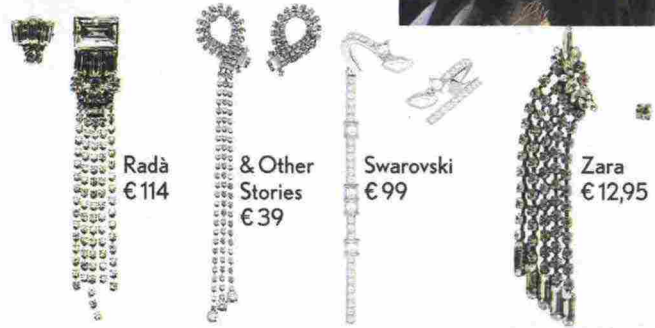
Radà € 114