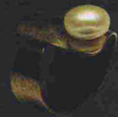
Azz da Brandstorming € 28