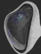
Ciclón € 45