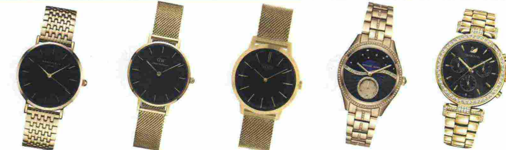
Rosefield € 109