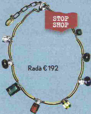
Radà € 192