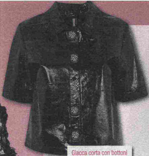
Giacca corta con bottoni gioiello (Topshop www.topshop.com ).