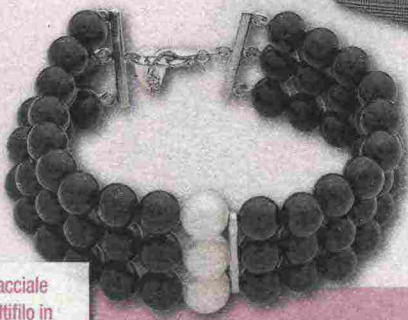
Bracciale multifilo in argento con perle (Mikiko www.mikiko.it ).