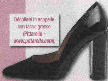
Décolleté in ecopelle con tacco grosso (Pittarello - www.pittarello.com ).