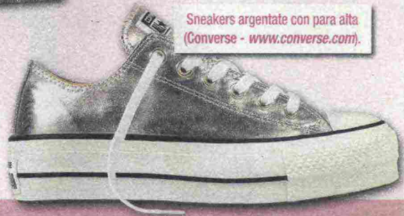
Sneakers argentate con para alta (Converse - www.converse.com ).