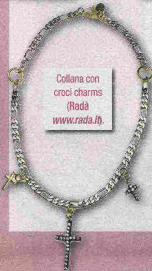
Collana con croci charms (Rada www.rada.it ).