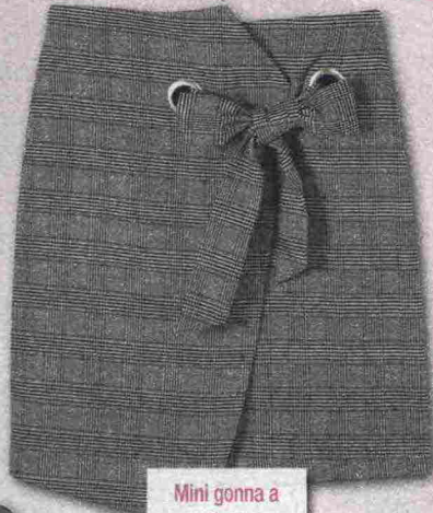
Mini gonna a portafoglio con stampa check (Kiabi - www.kiabi.it ).