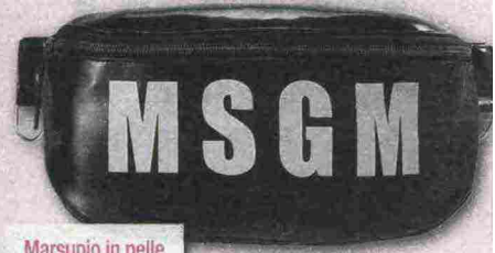
Marsupio in pelle con logo (MSGM www.zalando.it ).