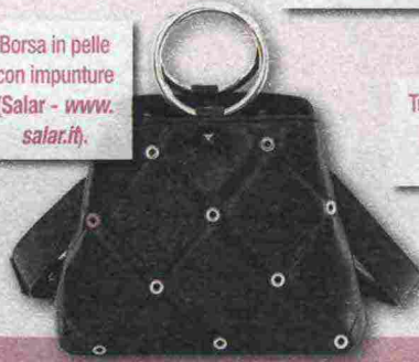
Borsa in pelle con impunture (Salar - www.salar.it ).