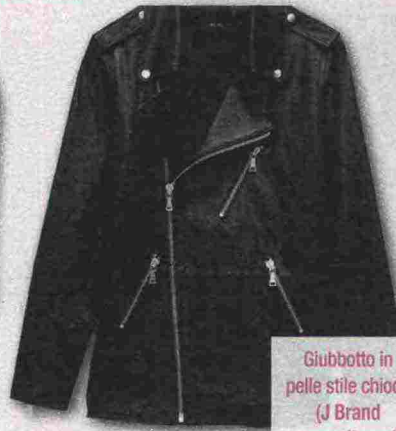
Giubbotto in pelle stile chiodo (J Brand www.jbrand.com ).