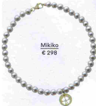
Mikiko € 298

MAGIC PEARLS Una sola perla come unico tocco di luce, oppure una cascata per rendere memorabile la mise. A te la scelta.