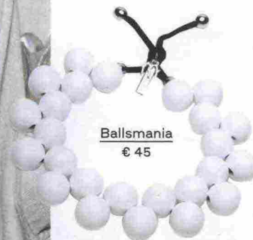
Ballsmania € 45