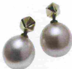
Atelier VM € 420