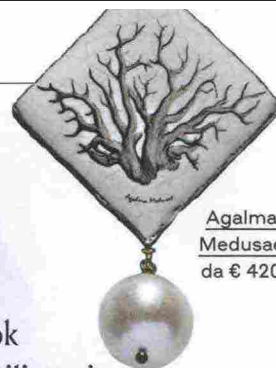
Agalma Medusae da € 420