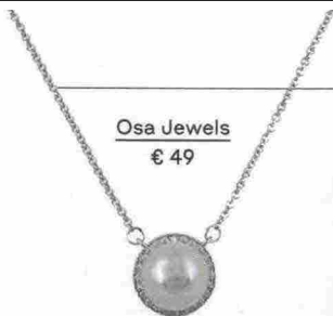
Osa Jewels € 49

Accendono gli outfit semplici, fanno scintille sui party look eccentrici: sono tutti i nuovi bijoux, tutte le pietre più desiderabili, tutti gli orologi da abbinare. E tu, sei pronta a fare bling-bling-shopping?