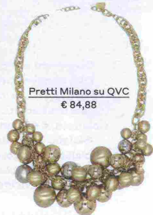
Pretti Milano su QVC € 84,88