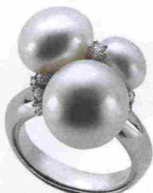
Nihama € 128