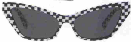
Occhiali da sole in acetato damier, Alain Mikli Paris (295 euro).