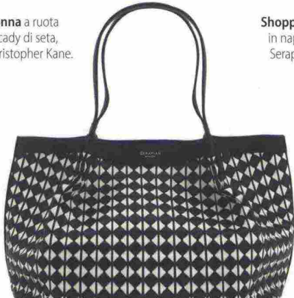
Shopping in nappa, Serapien.