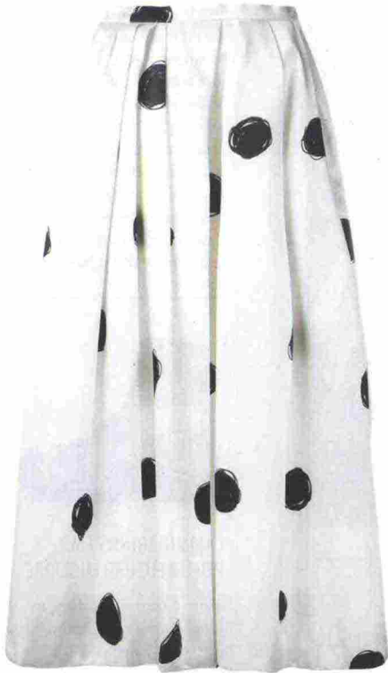
Gonna a ruota in cady di seta, Christopher Kane.