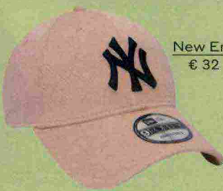
New Era € 32