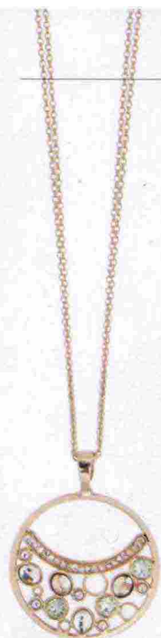
Boccadamo € 56