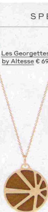
Les Georgettes by Altesse € 69