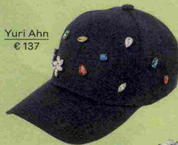
Yuri Ahn € 137