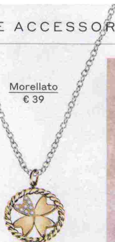
Morellato € 39