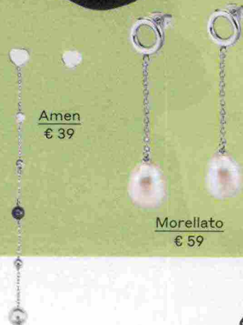
Amen € 39