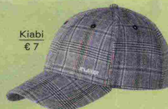
Kiabi € 7

Il giorno e la sera si incontrano in questo mix che affascina teenager e millennial. Il cappello sportivo e i pendenti con perle. Lo stile è nei dettagli.