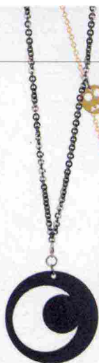
Ogm Plant € 49